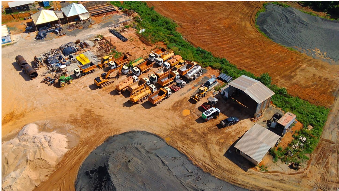
Figura 10: Pátio de máquinas e equipamentos – Drone, em 15/12/2025, Engenharia