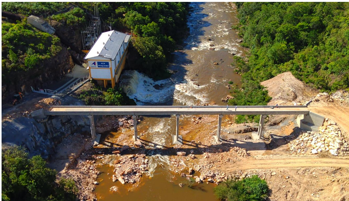
Figura 20: Ponte de serviço está em fase de conclusão. Drone, em 12/12/2025.

A ponte de serviço , entre a margem esquerda à direita, nas proximidades da casa de força da PCH Pesqueiro, se encontra em adiantado estado de edificação, mas ainda não permite o trânsito de veículos, como mostra a Figura 21. A previsão da conclusão desta Obra é para janeiro de 2026.