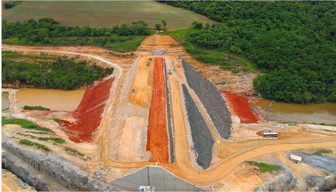
Figura. 04: Barragem – Drone, em 15/12/2025. Engenharia

A marca da altura máxima na cota 618,0 msnm., de 100%, está programada para ser atingida em 03/03/2026. As figuras 04 e 05 ilustram o estágio da obra em 15.12.25.