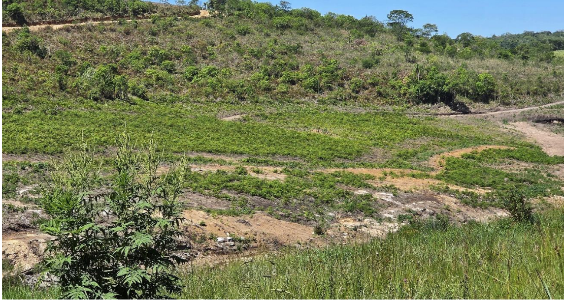
Figura 02: Área do Reservatório com rebrota de vegetação rasteira. 11.11.25 A.MULLER