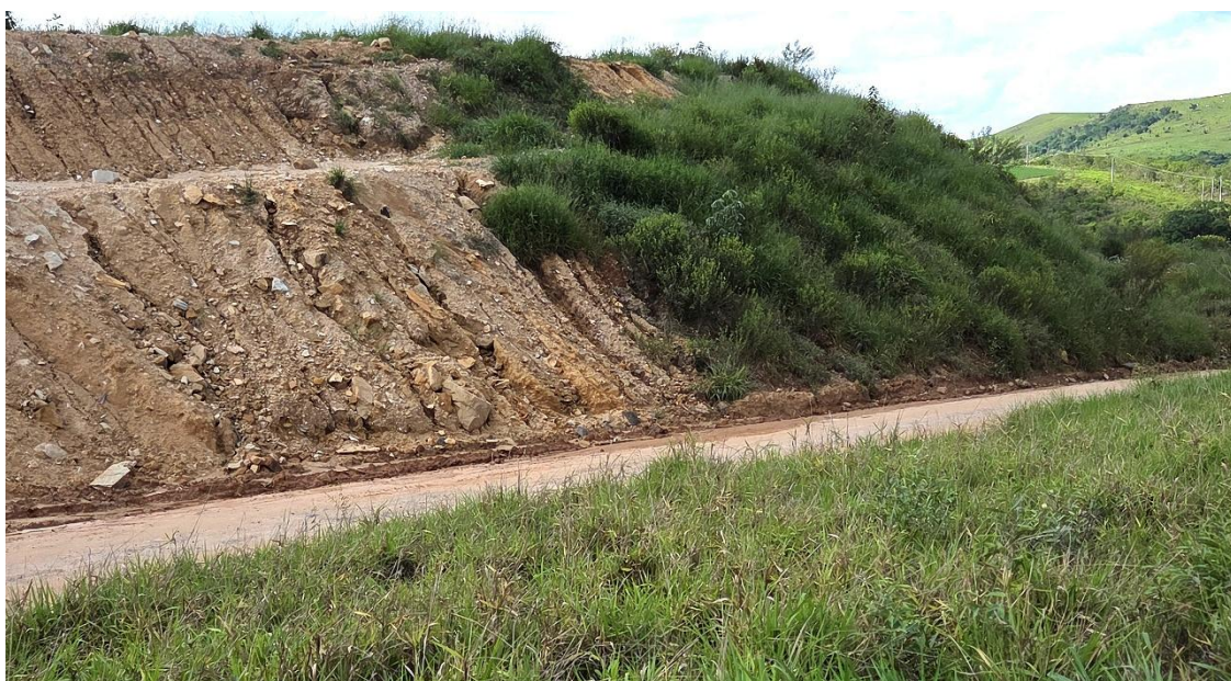
Figura 15: Bota-fora recuperado em setor recoberto com solo fértil. Em 15.12.25 A.MULLER

Os locais dos bota-foras foram escolhidos considerando a não geração de efeitos ambientais negativos. Preferiu-se, assim, os locais que serão inundados pelo reservatório. O primeiro – e único – estabelecido fora da área de alagamento (figura 15) está em processo de regeneração, resultado da cobertura parcial feita com solos férteis retirados do local da obra da PCH Beira Rio.