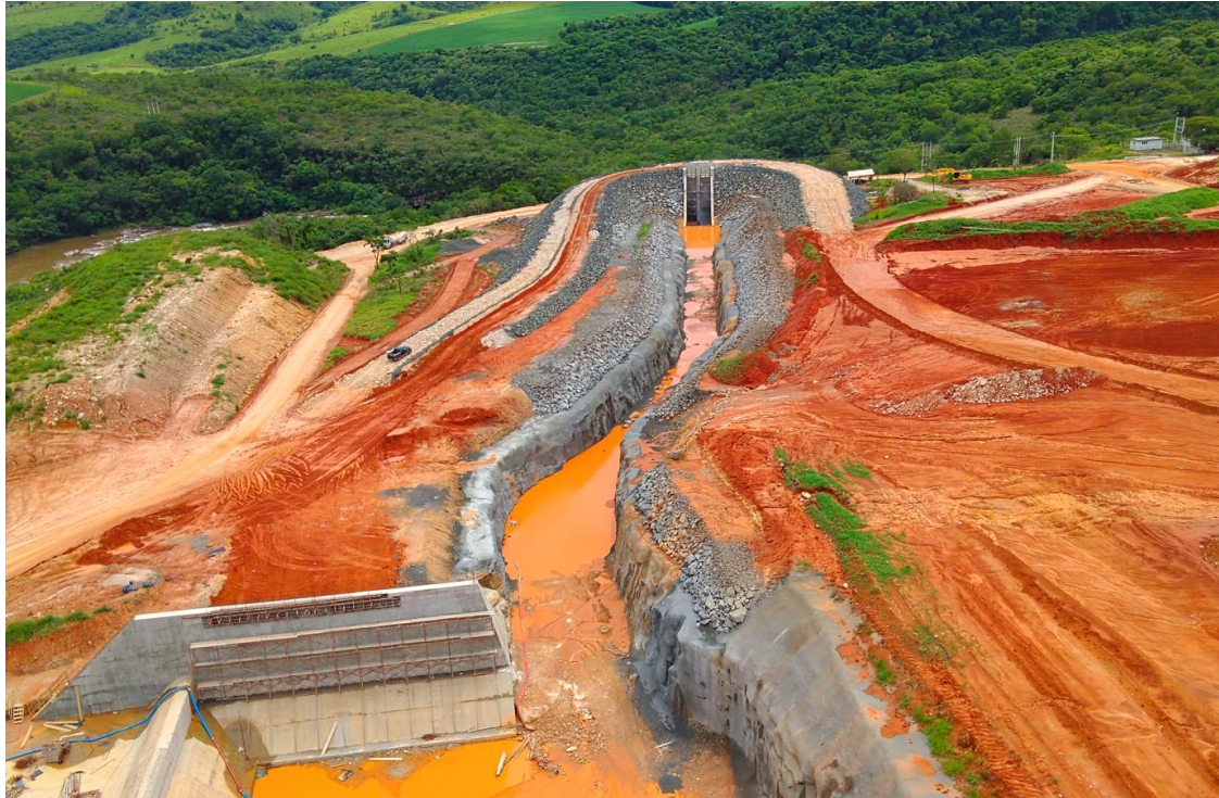
Figura 06: Vista aérea do Canal de Adução – Drone, em 15/12/2025. Engenharia

Com 95% concluído, as figuras 06 e 07 mostram que a situação em que se encontrava a estrutura em 15.12.25.