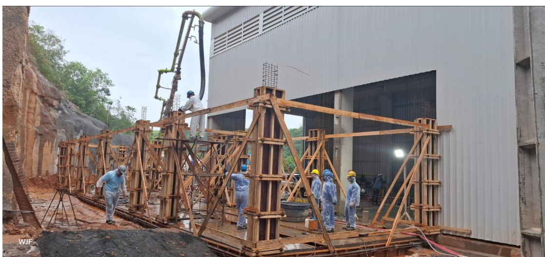
Figura 17: Edifício de controle da Casa de Força, em 12/12/2025. Engenharia