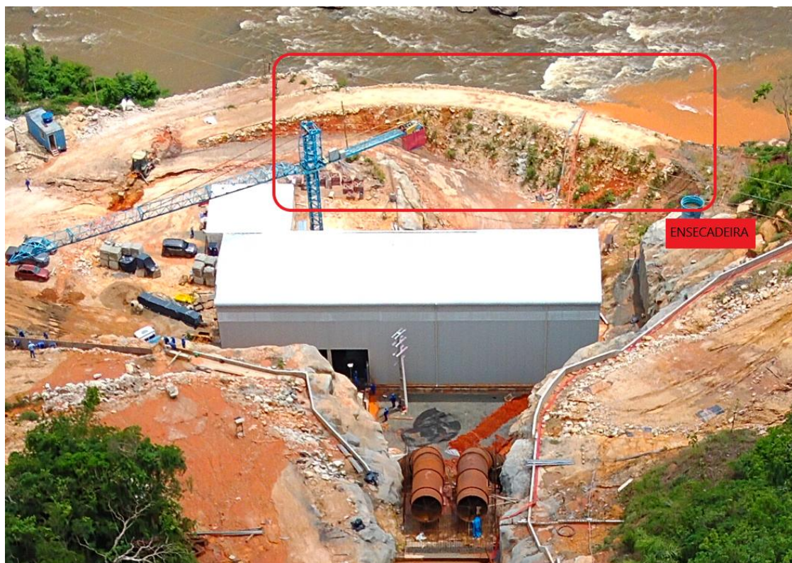
Figura 19: Ensecadeira do canal de fuga só será removida na fase da AA de Testes

O canal de restituição está construção. Sua ensecadeira só será retirada com a AA de Enchimento do Reservatório e Testes de Comissionamento (Figura 20).