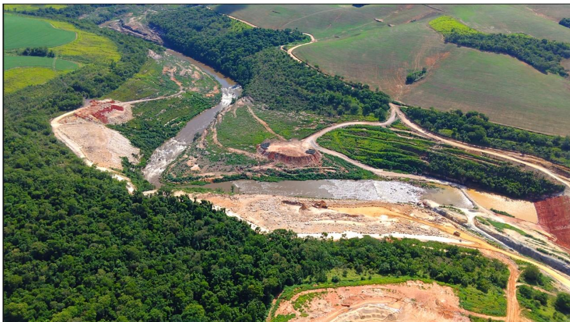
Fig. 01: Canteiro de Obras onde ocorreu a supressão – Drone, em 15/12/2025 Engenharia

A figura 01 (supressão na área do Canteiro de Obras), e as figuras 02 e 03, mostram a área onde ocorreu a supressão, percebendo-se pequena rebrota de vegetação rasteira, que será afogada. Até que isso ocorra, essa cobertura vegetal é eficiente e favorável para prevenir focos de erosão dos solos.