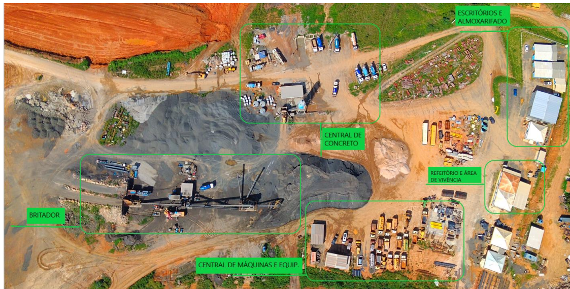
Figura 08: Layout do canteiro de obras – Drone, em 15/12/2025. Engenharia

As figuras 08 (com o layout atual do Canteiro), a 12, mostram a área do Canteiro de Obras em 15.12.2025