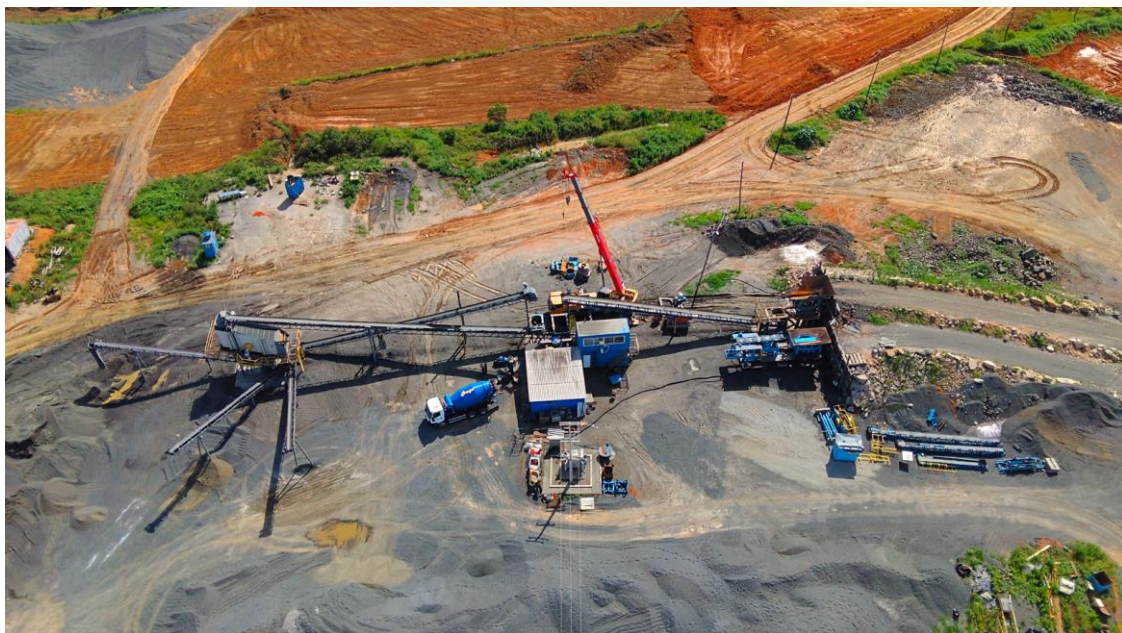
Figura 09: Britador – Drone, em 15/12/2025, Engenharia