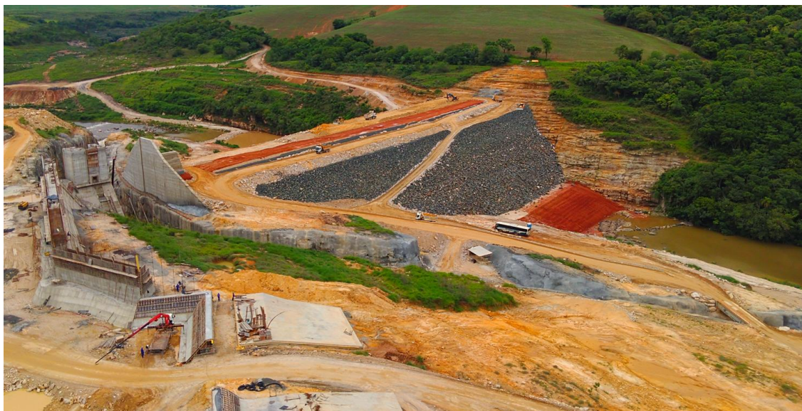
Figura 05: Barragem – Drone, em 15/12/2025 Engenharia