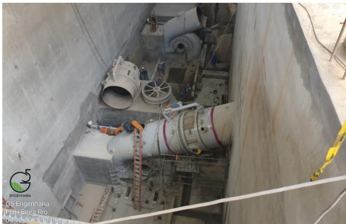
Figura 18: Montagem do sistema adutor na Casa de Força – em 04/12/2025. Engenharia