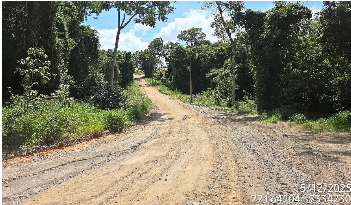
Figura 14: Acesso aterrado chegando ao Canteiro de Obras, em 15.12.25. A.MULLER