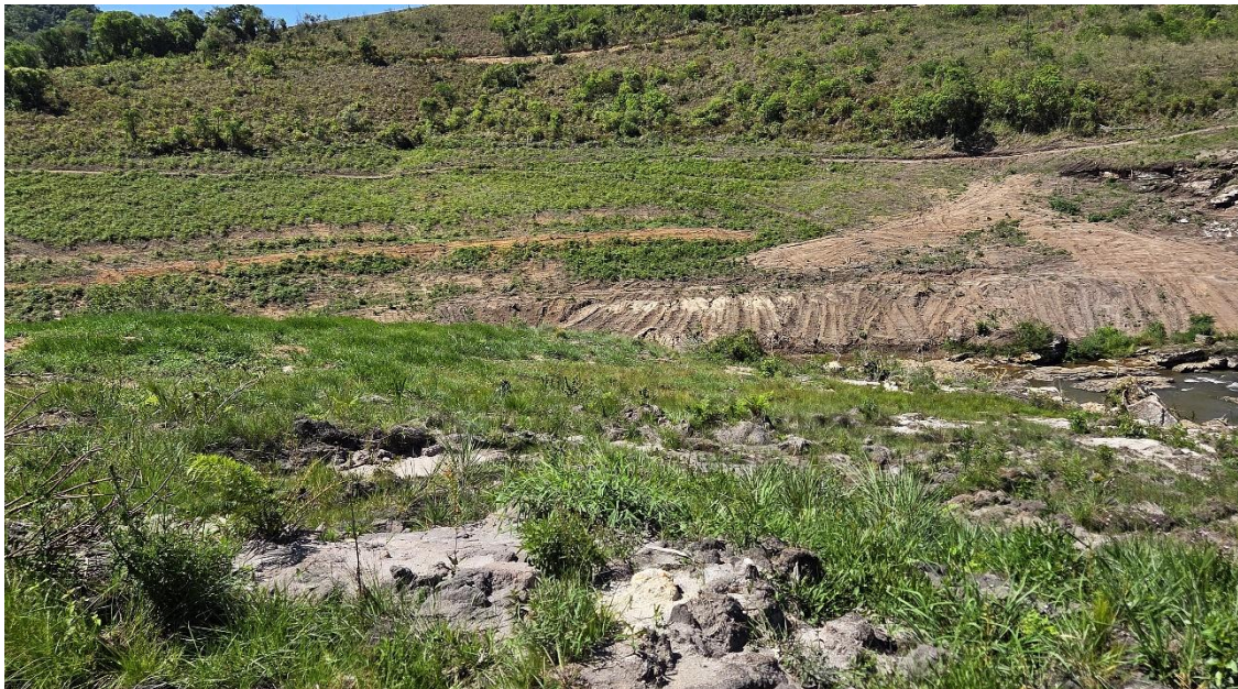
Figura 03: Reservatório com APP em regeneração após corte de pinus. 11.11.25 A.MULLER