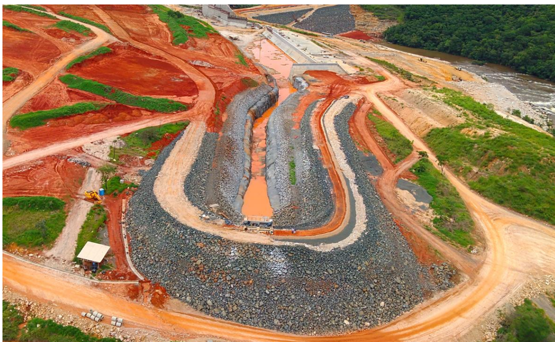
Figura 07: Canal de Adução – Drone, em 15/12/2025. Engenharia