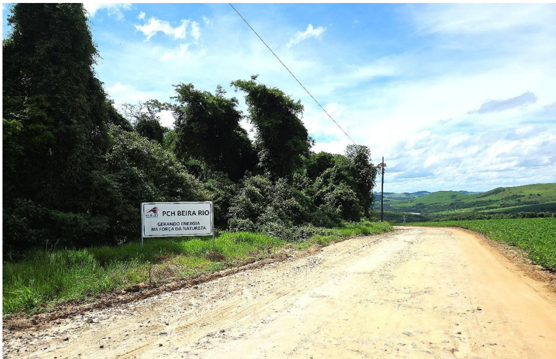
Figura 13: Acesso desde a estrada da Faz Sta Maria até a Obra, em 15.12.25 A.MULLER

Só há um acesso à Obra, saindo na altura do Km 2,65 da estrada rural da Fazenda Sta. Maria. Por este acesso, pavimentado com basalto fragmentado, se percorre 600 metros até adentrar na área dos galpões do Canteiro de Obras (figura 13), após passar por um pequeno trecho que necessitou ser elevado (Figura 14).